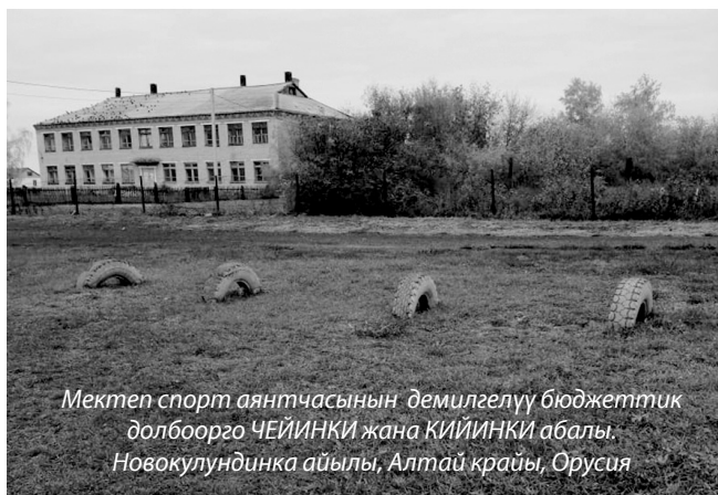
Мектеп спорт аянтчасынын демилгелүү бюджеттик долбоорго ЧЕЙИНКИ жана КИЙИНКИ абалы. Новокулундинка айылы, Алтай крайы, Орусия

Институционалдык базаны бекемдөө. Типтүү документтердин (КР Өкмөтүнө караштуу Жергиликтүү өз алдынча башкаруу иштери жана этностук мамилелер боюнча мамлекеттик агенттиктин 2019-жылдын 5-сентябрындагы №01-18/84 буйругу менен бекитилген “Жергиликтүү өз алдынча башкаруу органдары тарабынан жергиликтүү демилгелерди тандоонун жана каржылоонун тартиби жөнүндө” Типтүү жобо, “Жарандарды жана алардын бирикмелерин тартуу менен жергиликтүү маанидеги маселелерди чечүү боюнча жергиликтүү өз алдынча башкаруу органдарынын ишине биргелешкен мониторинг жана баалоо жүргүзүү жөнүндө” Типтүү жобо) бар болгонуна карабастан жергиликтүү өз алдынча башкаруу органдарынын потенциалын мындан ары да жогорулатуу зарыл. Кыргыз Республикасындагы муниципалитеттердин көптүгүн жана кадрлардын тез-тез алмашуусун эске алуу менен бардык ЖӨБ органдарын бир убакта окутуу дээрлик мүмкүн эмес. Мындай учурда демилгелүү бюджеттөөнүн долбоордук борборлорун түзүү натыйжалуу аспап болгонун практика ырастап турат. Долбоордук борборлор демилгелүү бюджеттөө практикасынын дизайнын жана зарыл документтерди иштеп чыгуу менен алектенишет; маалыматтык өнөктүктөрдү уюштурууга, чогулуштарды, сурамжылоолорду жана жарандардын пикирлерин аныктоонун башка формаларын өткөрүүгө көмөктөшөт; жашоочулар сунушкылгандолбоорлордоталдашат, аларды толук иштеп чыгууга көмөк көрсөтүшөт; жергиликтүү өз алдынча башкаруу органдарынын, коомдук