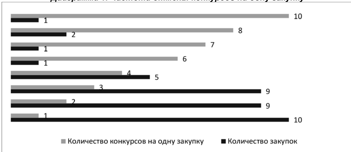
Диаграмма 1. Частота отмены конкурсов на одну закупку

(требований), и рекомендации к квалификационным требованиям к закупке товаров состоят из 15 пунктов (требований). Соблюдение данных рекомендаций к квалификационным требованиям при проведении процедур закупок намного улучшили навыки, опыт и знания специалистов по закупкам муниципалитетов, а также помогли повысить потенциал поставщиков услуг, работ, товаров.