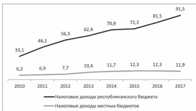
Диаграмма 1. Динамика налоговых доходов республиканского и местных бюджетов, млрд. сомов

представленный на диаграмме 1, также выявляет неблагоприятную тенденцию. В сравнении с темпами роста налоговых доходов республиканского бюджета, налоговые доходы местных бюджетов практически не растут. Небольшой всплеск наблюдался только в 2014-2015 гг., а затем в течение следующих двух лет вновь наблюдалось снижение общего объема доходов местных бюджетов, тогда как доходы республиканского бюджета росли устойчивыми темпами. В 2017 г. доля налоговых поступлений в общих доходах местных бюджетов составила 58,8%.