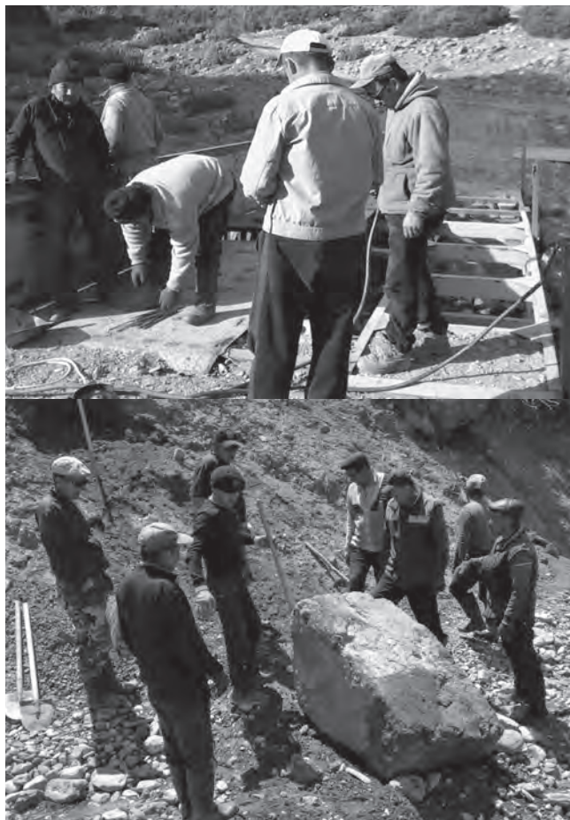
өрүк, 300 даана жида, 206 түп Тянь-Шань карагайы отургузулду. Жаратылышты коргоо боюнча Ысык-

Көл-Нарын фондуна жалпы суммасы 950 000 сом болгон гранттык долбоор жаздык.