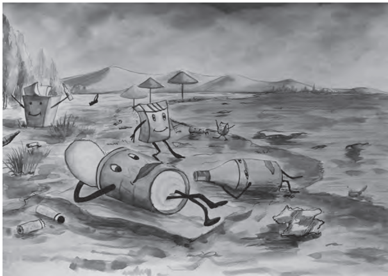
Плакаттын автору – Жылдызбек БОЛОТБЕКОВ, “Тың жашоо: ушул тапта, ушул жерде” плакаттар сынагынын катышуучусу, 2015-ж.

Кызмат көрсөтүүнү аутсорсингге өткөргөндө бийликтин аткаруучу органдарынын жарандарды