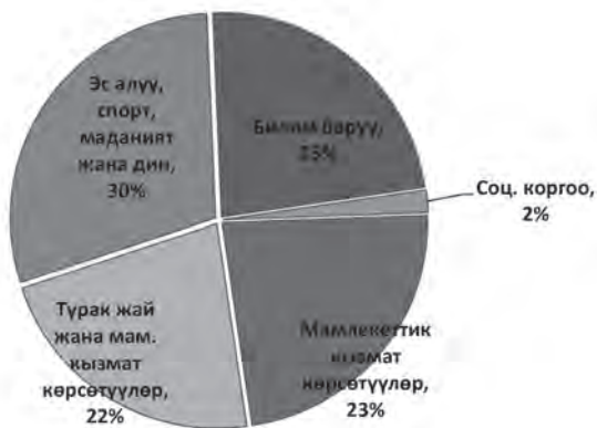
1-сүрөт. 2015-жыл үчүн бюджеттин аткарылышынын фактысы